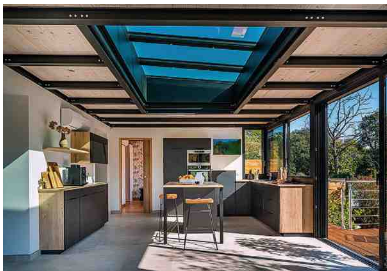
La véranda est de plus en plus utilisée comme une surface accueillant des pièces de vie, comme une cuisine.

Quand on pense à une véranda, on a le plus souvent l'image d'un jardin d'hiver au charme rétro... et au confort aléatoire, trop chaud en été et trop froid l'hiver. Une image bien loin de ce que proposent aujourd'hui les professionnels de la véranda, comme Falliero, pionnier de ces extensions sur le Sud aquitain depuis cinquante ans. « Aujourd'hui, une véranda peut résister à la chaleur et au froid, à condition d'utiliser des matériaux de qualité. Nous travaillons avec des vitrages techniques qui permettent de repousser la chaleur et, dans le cadre de vérandas exposées plein sud, avec des toitures isolantes en plein qui apportent plus de confort. On peut enfin ajouter des options, comme des volets roulants électriques pour avoir plus de modularité et en profiter toute l'année », ex-