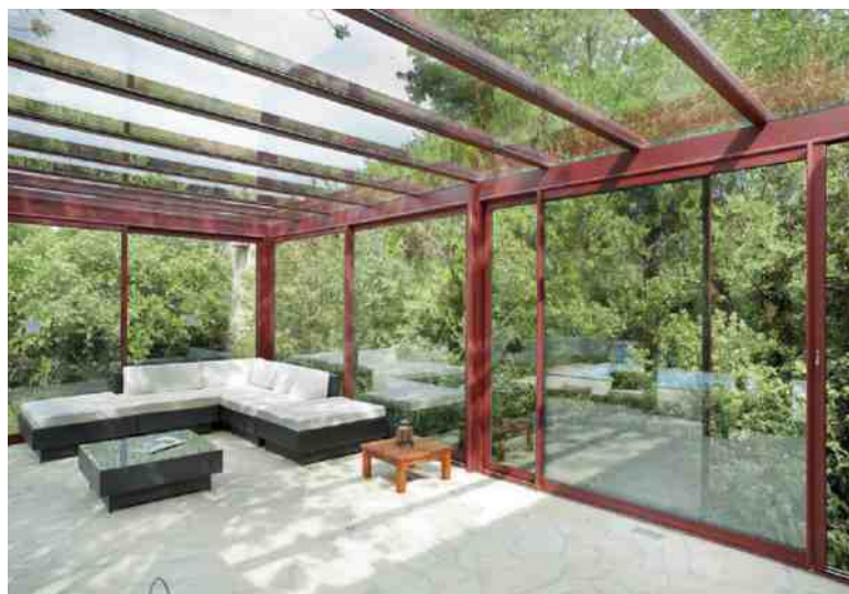
En zone urbaine, une déclaration préalable suffit pour créer une véranda jusqu'à 40 m 2 .

Construire une véranda ne s'improvise pas. Comme toute extension, elle répond à des règles bien spécifiques et nécessite de prendre ses précautions. À commencer par s'assurer que le coefficient d'emprise au sol, définissant la surface constructible d'une parcelle, ne soit pas dépassé. Le PLU (plan local d'urbanisme) de la commune peut également fixer des règles concernant les matériaux utilisés pour la création d'une véranda. Autre critère, la distance à respecter pour ne pas enfreindre les règles de mitoyenneté, généralement au moins 3 mètres en recul des limites de propriété. Dans la plupart des cas, l'entreprise chargée de concevoir la véranda se charge de toutes ces vérifications avant d'établir un projet. Il n'est en revanche pas toujours nécessaire de déposer un permis de construire pour une véranda ou une extension de maison. Dans les communes couvertes par un PLU en zone urbaine,